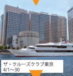
ザ・クルーズクラブ東京 4/1~30