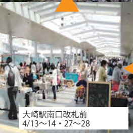
大崎駅南口改札前 4/13~14・27~28