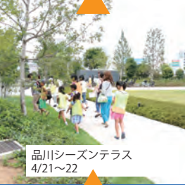
品川シーズンテラス 4/21~22