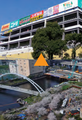
東品川海上公園 4/7~8・14~15