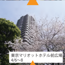
東京マリオットホテル前広場 4/6~8