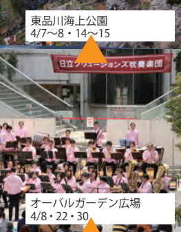
オーバルガーデン広場 4/8・22・30